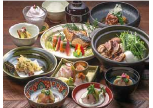
식사는 방에서 제공되며 요리는 계절에 따라 바뀔 수 있습니다.